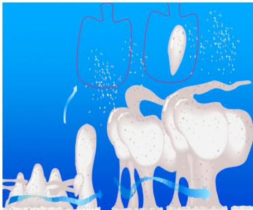
Biofilm élastique : détachement de paquets de micro-organismes

Lorsque des problèmes de dérive microbologique ou de dépassement de Légionelles par culture (NF T90 431) sont révélés sur une installation, il est nécessaire de prendre les bonnes décisions en terme d'actions correctives, d'appliquer un traitement et de s'assurer de son efficacité à court et à long terme.